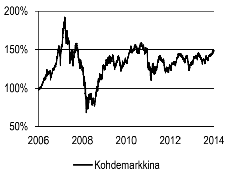
Kuva 1. Kohdemarkkinan hintakehitys 19.8.2006–19.8.2014 (19.8.2006 = 100). Kohdemarkkinan tuotot on esitetty paikallisvaluutoissa. Historiallinen tuotto ei ole tae tulevasta tuotosta.

Uskomme, että valitsemamme kansainväliseen kauppaan keskittyvät kansantaloudet tulevat nousemaan eturintamassa seuraavan viiden vuoden aikana, kun maailmantalous kiihdyttää jälleen vakaammalle kasvu-uralle.