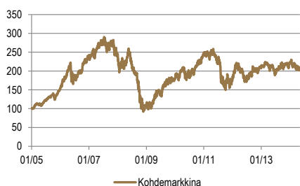
Kuva 1. Kohdemarkkinan hintakehitys 1.1.2005–8.5.2014 (1.1.2005 = 100). Kohdemarkkinan tuotot on esitetty paikallisuusvaluutoissa. Historiallinen tuotto ei ole tae tulevasta tuotosta.

Osa yhtiöistä on myös kärsinyt Venäjän ja Ukrainan välisen kriisin vaikutuksista Venäjän talouteen, mikä tarjoaa sijoittajalle nyt hyvän mahdollisuuden sijoittaa kyseisiin yhtiöihin osittaiselle pääomasuojalla rakennesijoituksen kautta.