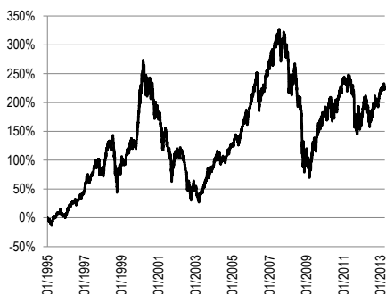
Kuva 1. ML Hansa 6/2018 Maltillinen -sijoituskorin kohdemarkkinan historiallinen kehitys 3.1.1995 - 28.3.2013 (Lähde: Bloomberg). Historiallinen tuotto ei ole tae tulevasta tuotosta.

Mandatum Life Hansa 6/2018 Maltillinen tarjoaa mahdollisuuden sijoittaa Itämeren alueen osakemarkkinoille rakenteella, jolla hyödyt mahdollisesta kurssinoususta ilman tuottokattoa. Kurssiriskiä puolestaan rajoittaa osittainen pääomasuoja. Kohdemarkkina kokonaisuudessaan, mutta erityisesti Suomen ja Ruotsin osakemarkkinat, ovat verrattain herkkiä talouden suhdanteille, minkä vuoksi ne soveltuvat hyvin kohde-etuudeksi rakenteeseen, jossa enimmäistuottoa ei ole rajattu tuottokotolla, mutta kurssiriskiä rajataan osittaisella pääomasuojalla.